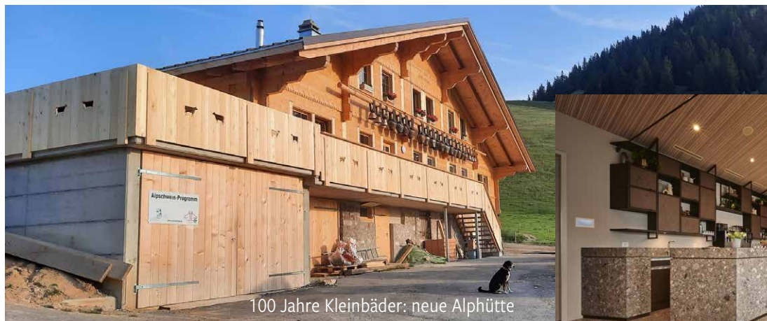
100 Jahre Kleinbäder: neue Alphütte