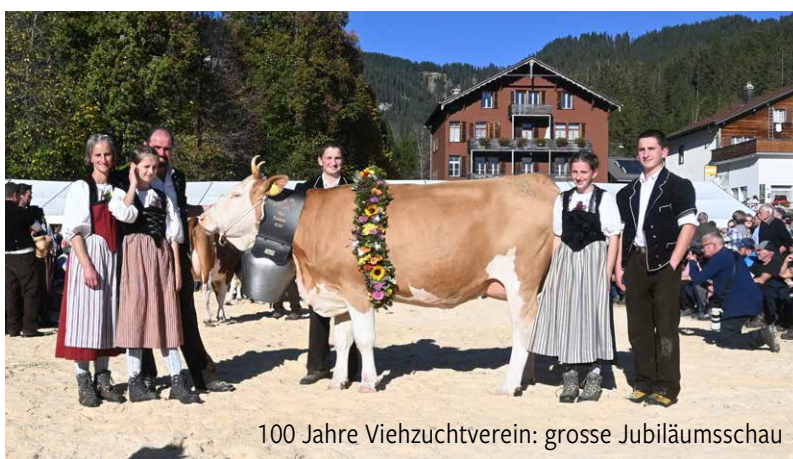
100 Jahre Viehzuchtverein: grosse Jubiläumsschau