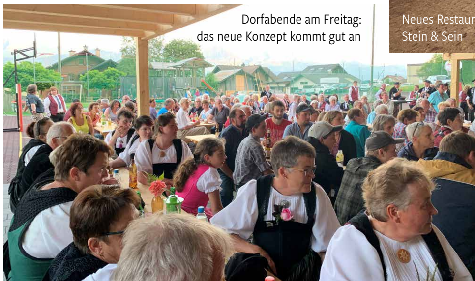
Dorfabende am Freitag: das neue Konzept kommt gut an