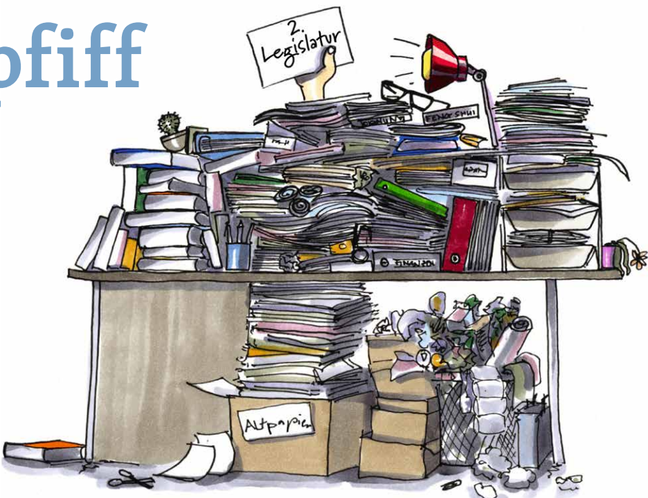
Zeichnung: Roland Noirjean

Ich wurde von verschiedenen Seiten bestärkt und habe jetzt vier Jahre später eine Legislatur als Gemeindepräsident bestritten. Zusammen mit meinen Ge-