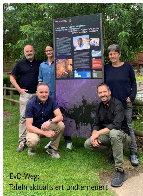
EvD-Weg: Tafeln aktualisiert und erneuert